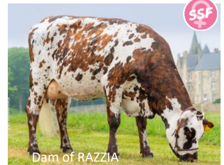
Dam of RAZZIA