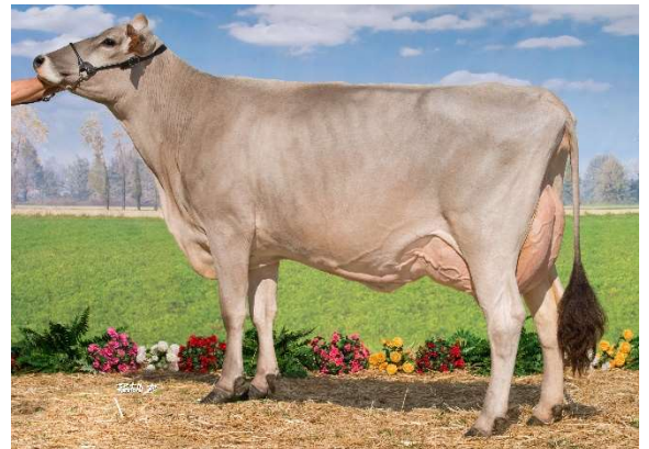
Fiona , abuela de OXYGENE

Este primogénito de Antonov de Francia puede convencer a cualquier ganadero con su larga lista de cualidades. Su abuela es la famosa Fiona que hoy nos entrega otro toro elite. OXYGENE tiene muchísima leche con +1162 kg , la fertilidad de sus hijas se encuentra entre las mejores de los toros disponibles, la velocidad de ordeño es muy positiva y la longevidad de las hembras completan su gran perfil funcional . También es un toro sobresaliente en morfología, con excelente líneas dorsales, buen ángulo de grupa, buena altura de talón y ubres muy buenas con excelente tamaño de pezones , ideal para sistemas tipo robot . Además está en el TOP de facilidad de nacimiento y es BB/A2A2 . Disponible en semen sexado .