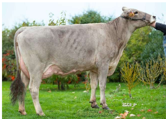
Myrza , hija de JEROBOAM

¡Dejó una gran impresión en el Show de Paris 2020 con 8 hijas para el concurso Miss BGS!