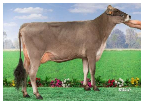
Martienne , hija de JOYAU

¡Un toro probado realmente muy completo, como su padre Anibal!!