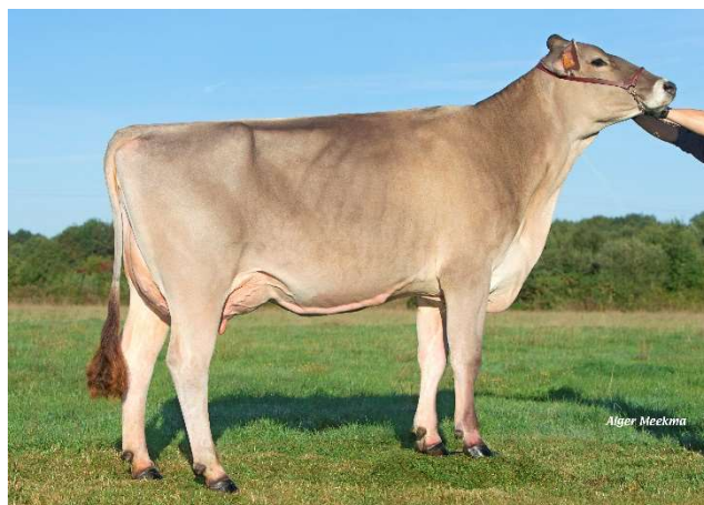
Lilipus , madre de O MALLEY

La estrella internacional permanece en el TOP siendo el #2 en GZW con 1481 en Suiza y 143 en ubre . ¡Es el toro joven más alto del mundo en ISU con 181! Con el nuevo sistema de Italia se encuentra en el puesto #43 de toros disponibles con 1078 ITE , con 135 en morfología y es el mejor hijo de Bender. Ahora está disponible en EE.UU y ocupa el puesto #30 en PPR con 161 . Nuestro toro más solicitado mantiene su perfil de calidad de leche, rasgos súper funcionales y excelente morfología. Es BB/A2A2 y está disponible en sexado