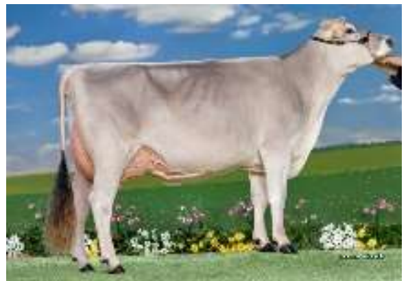
Mana , Madre de OPTIMAL

¡Es el nuevo toro elite de Francia, que no debes perderte! Con 1456 GZW es el #7 de los toros disponibles en Suiza con 132 en ubres . Esta también como el #7 en Alemania con 129 GZW y también con 131 para ubres . Este hijo de Sinatra tiene una famosa genética: Su madre Mana (Blooming) es una de las mejores vacas de Francia y represento a su país en el Show de Verona. Tiene muchísima leche y tiene el paquete completo como toda la familia Fiona, además es BB/A2A2 y está disponible en sexado .