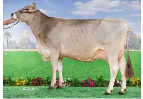
Louisiane , madre de ORTOLAN

Este nuevo toro proviene de la familia Japonaise, una de las más destacadas en fortaleza para el promedio Francés. Su padre Lordain (Glarus x Vassli) es un toro muy alto en leche con ubres muy fuertes , cualidades que heredo ORTOLAN. ¡Su puntaje en ubres es muy bueno, en Alemania tiene 129 y 126 en Suiza!. Sus hijas tendrán excelentes ubres, de buena altura , muy buena inserción y pezones ideales . Alto % de Proteína y gran salud de ubre completan el perfil de este toro que es A2A2 y esta disponible en semen sexado .