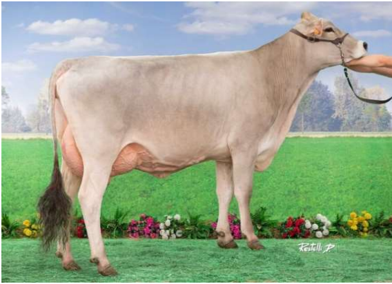
Miss , Madre de OPENBAR

Este toro hace parte de la familia Futee tiene el paquete ideal para rebaños comerciales que buscan vacas de talla media con todas las ventajas de la Pardo Suizo: Calidad de leche, excelente salud de ubre , hembras muy fértiles y mucha longevidad . El campeón de la morfología con ubres de buena altura, patas y pezuñas muy fuertes y pezones ideales . Con buena facilidad de nacimiento puede ser una buena opción para los programas de cruzamiento. También ocupa muy buenas posiciones en el extranjero con 1410 GZW en Suiza, que lo ubican en el puesto #12. Es BB/A2A2 y está disponible en sexado .