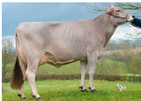
Jolie GP, madre de NICE GP

Este hijo de Fact permanece en el TOP de los toros para I.A. en Suiza, en el puesto #29 con 1372 y 131 para ubres . NICE GP es uno de los toros particulares de MGS para transmitir excelentes ubres , como su abuelo Calvin. Él ahora tiene varios hijos e hijas importantes que encabezaron la lista de GZW en Suiza. Esperamos con ansias el futuro de este toro, especial para ubres y fertilidad en sus hijas, salud de ubres, velocidad de ordeño y longevidad ... ¡sin sacrificar volumen de leche! Es BB/A1A2 y está disponible en sexado .